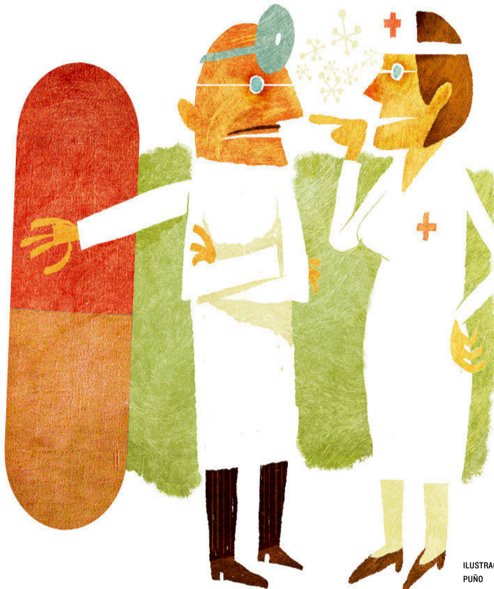
ILUSTRACIÓN DE PUÑO

Las estadísticas confirman que se va más a la farmacia que al médico